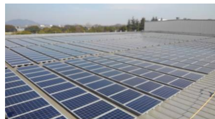
群馬県館林市 システム容量：432kW