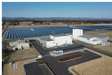
福島県浪江町 システム容量：20MW