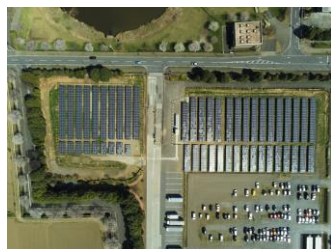
埼玉県坂戸市 システム容量：1.4MW